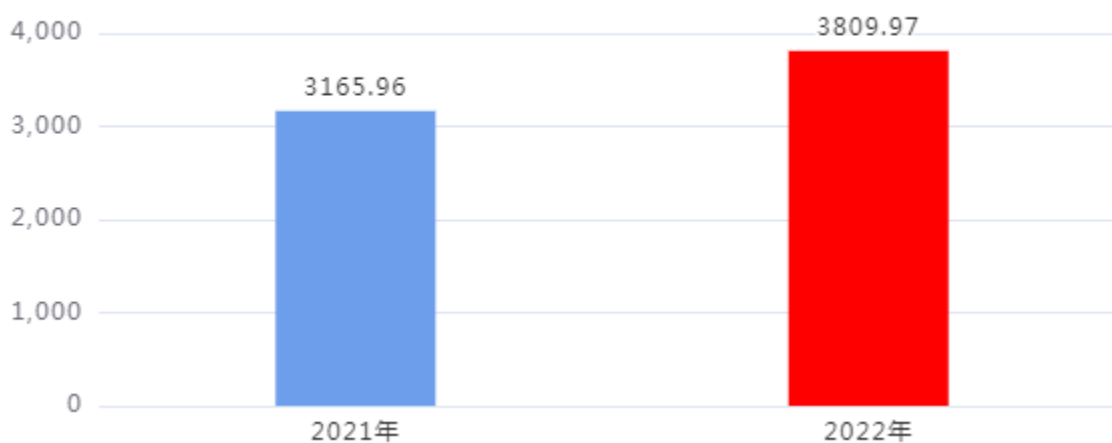
一般公共预算财政拨款支出决算变动情况图（单位：万元）

2022年度一般公共预算财政拨款支出3,809.97万元，占本年支出合计的99.97%。与2021年度相比，一般公共预算财政拨款支出增加644.01万元，增长20.34%。主要是学生增加，教职工增加。