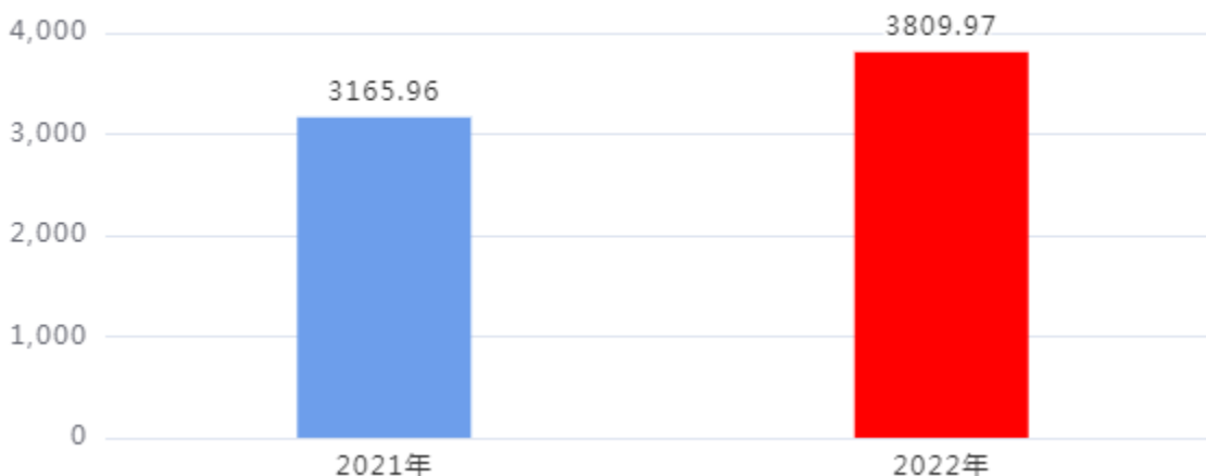
财政拨款收、支决算总计变动情况图（单位：万元）

2022年度财政拨款收、支总计3,809.97万元。与2021年度相比，财政拨款收、支总计各增加644.01万元，增长20.34%。主要是学生增加，教职工增加。