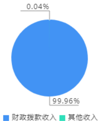
本年收入决算结构图

本年收入合计3,811.31万元，其中：财政拨款收入3,809.97万元，占99.96%；其他收入1.34万元，占0.04%。